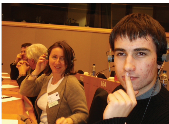
Des Costarmoricains à Bruxelles

Un séminaire intitulé "Des alternatives sur l'emploi en Europe"... Bah, une balade à Bruxelles, oui ! Une belle occasion d'aller se "délect-enivrer" de bières fameuses ! C'est ce que vous pensez, avouez-le ! Vous n'y êtes pas. Bruxelles et, de surcroît, l'emploi en Europe, cela semblait loin, très loin de mes préoccupations professionnelles, qui, somme toutes, sont très locales. Dans les dédales du Parlement Européen, je me sentais un grain de sable :