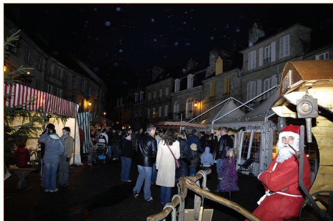
"Coop'art22 expérimente les marchés clés en mains"

Projet retenu dans le cadre des travaux dirigés de la licence professionnelle "Ecrits pour les organisations" de l'IUT de Lannion, la communication du concept de "marché artistique et artisanal clés en main" de Coopart22, sera élaborée par quatre étudiants dont l'enthousiasme et les qualités laissent préjuger de belles réalisations. Cette action est soutenue par le dispositif FSE 10B de la communauté européenne.