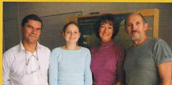
Les permanents de Chrysalide à Pont-L'Abbé et Brest

Ainsi, les équipes de Chrysalide à Pont L'Abbé et Brest, d'Élan Créateur à Rennes et de l'Ouvre Boîte 44 à Nantes, nous ont accueillis avec beaucoup de cordialité et de compétences. Techniques d'accompagnement, ingénierie financière, droit fiscal et social, responsabilité assurantielle et ... esprit coopératif, rien n'a manqué à ce transfert de savoir faire. Merci à vous tous qui avez eu la patience de répondre à nos nombreuses questions.