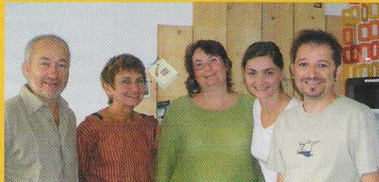
Les permanents de l'Ouvre-boîte 44 à Nantes