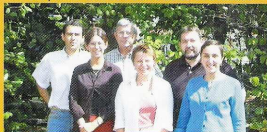
Les permanents d'Élan Créateur à Rennes