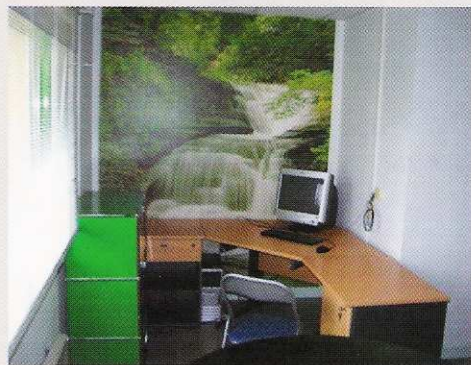
L'atelier des Entrepreneurs, un espace qui leur est réservé

Dominique BABILOTTE 02 96 52 19 69 avant-premieres@wanadoo.fr